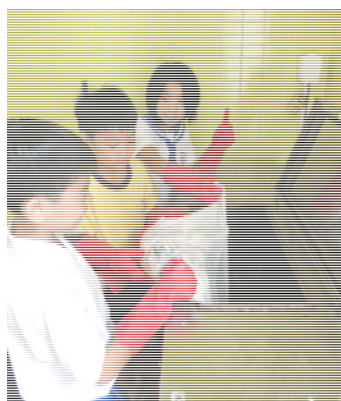
將剩餘飯菜倒進廚餘機