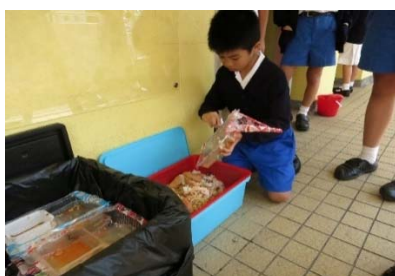
學生收集剩餘飯菜

學生在午飯後，把吃剩的飯菜放進廚餘機，轉化為有機肥料，用作學校的植物作堆肥之用。學生在處理廚餘的時候反省自己的飲食習慣，以及浪費食物對環境所帶來的影響，鼓勵學生改變浪費食物及減少吃剩飯菜的行為，提升學生珍惜地球資源和保護環境的意識。